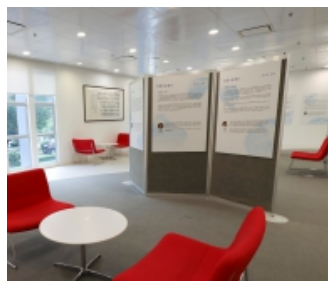
得獎作品在大學圖書館展出。